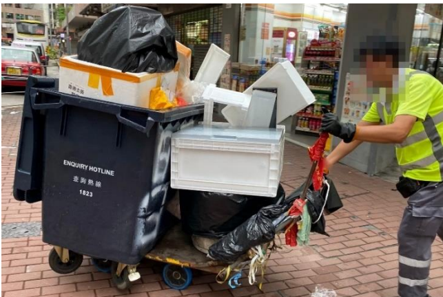
圖(五). 食環署收集三無大廈垃圾的 660 垃圾筒，裡面有很大包的黑色袋裝垃圾，工友表示有店舖濫用將食肆及店舖垃圾棄置在內，令垃圾筒很快裝滿，就有街坊會放在垃圾筒旁。