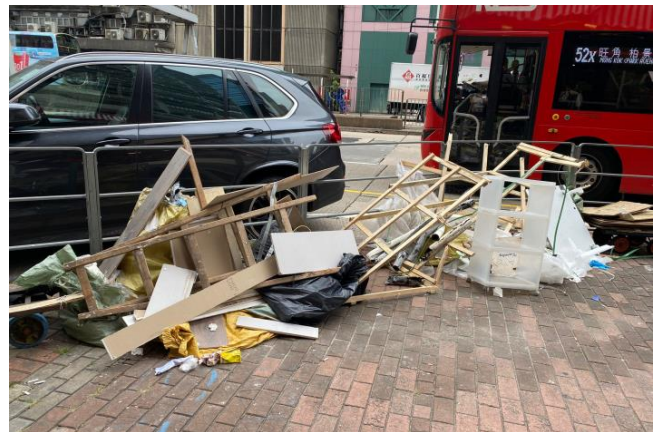
圖(六). 拆散的傢俱隨意被棄置到馬路旁邊。工友需要推超過四個街口才運到垃圾站。