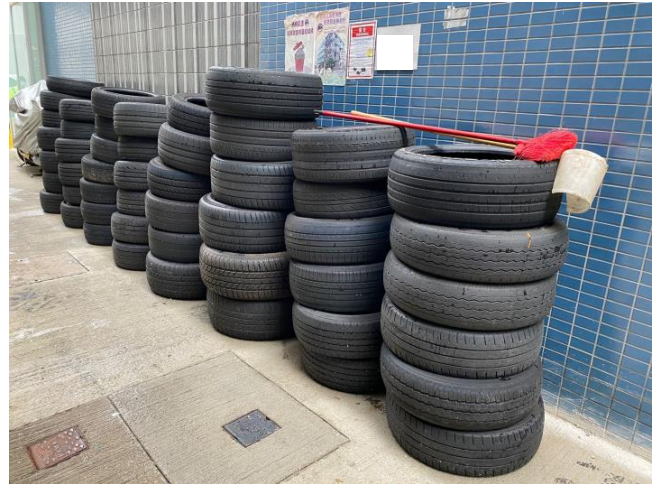
圖(八) 車行將輪胎棄置到後巷，最後都是由工友推去垃圾站，再交由環保署處理。