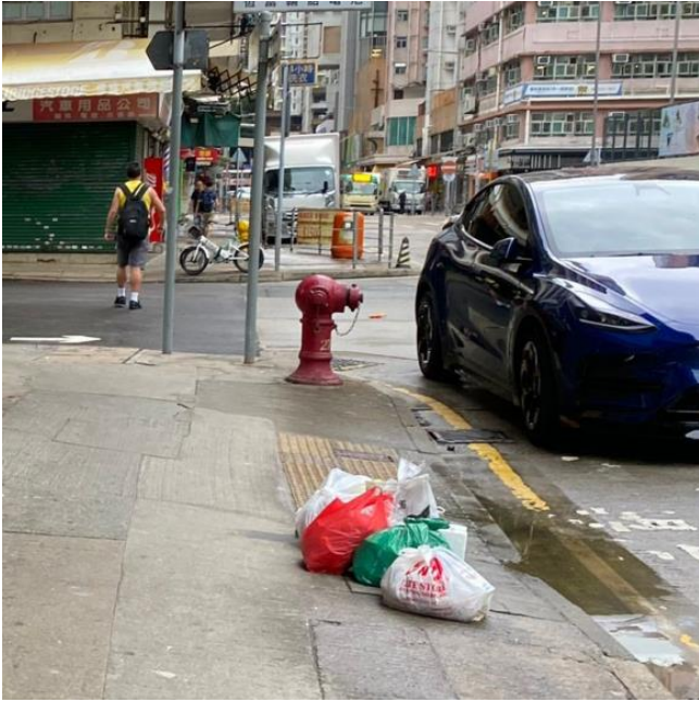
圖(三). 三無大廈住戶棄置家居垃圾在街邊。