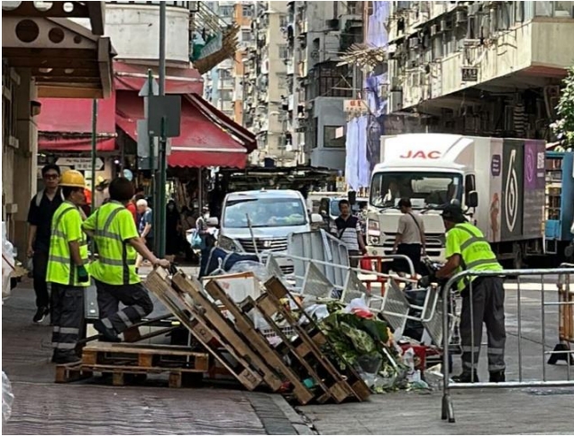
圖(七) 工友在處理店舖棄置的卡板和垃圾。