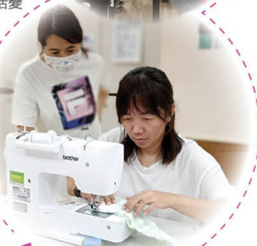
桐桐在教授車縫遮袋的心得