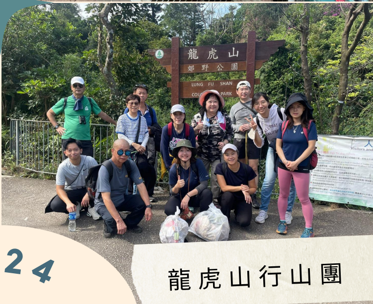
紅十字會焦點小組