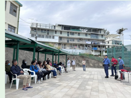
明順伯多祿火警演習