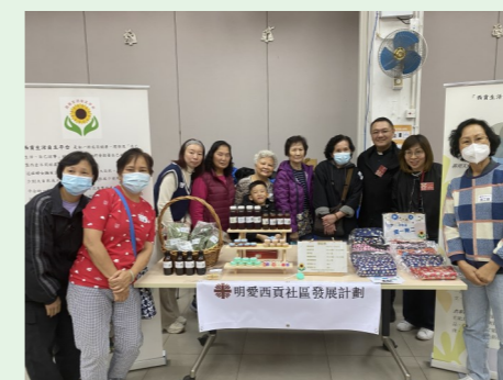
牛頭角明愛年宵活動