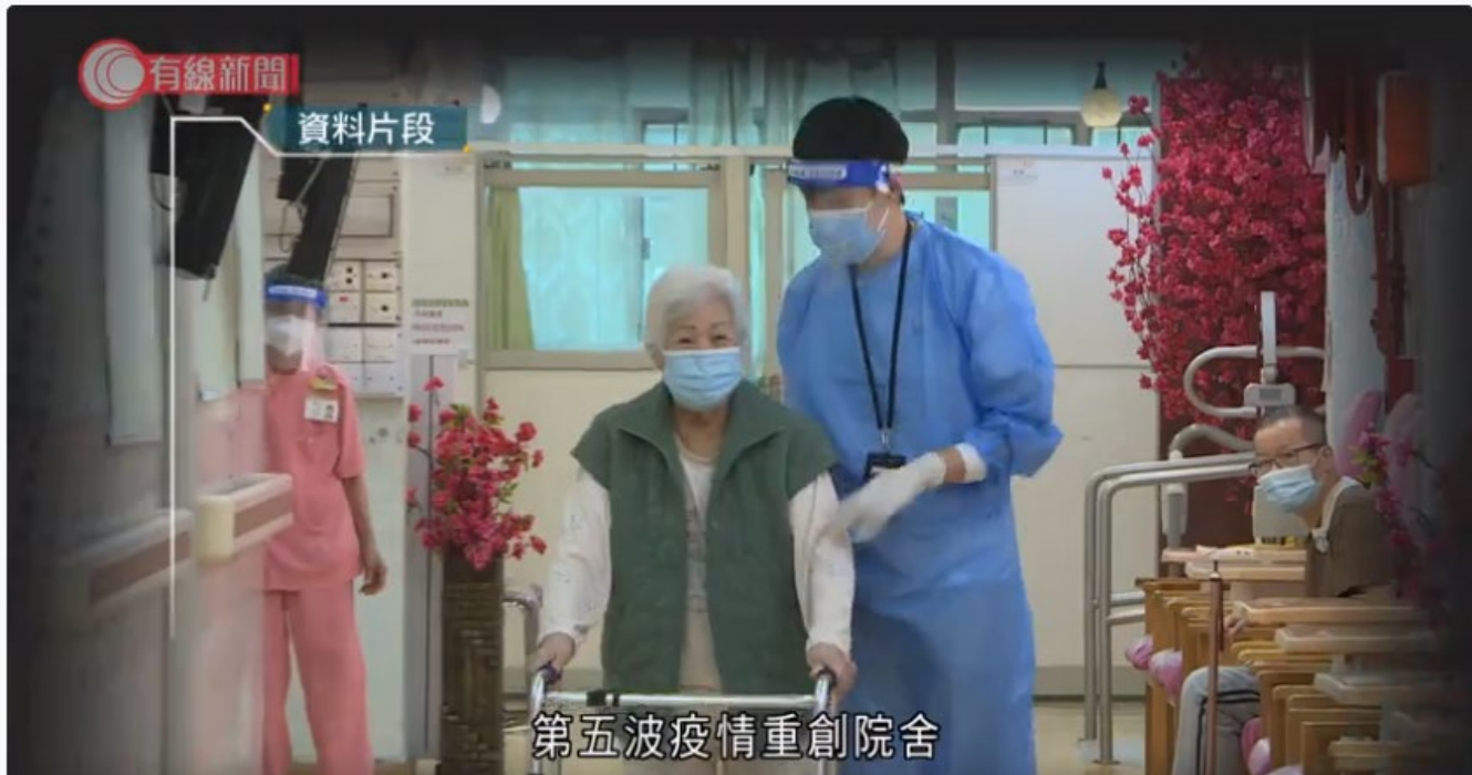
第五波疫情重創院舍