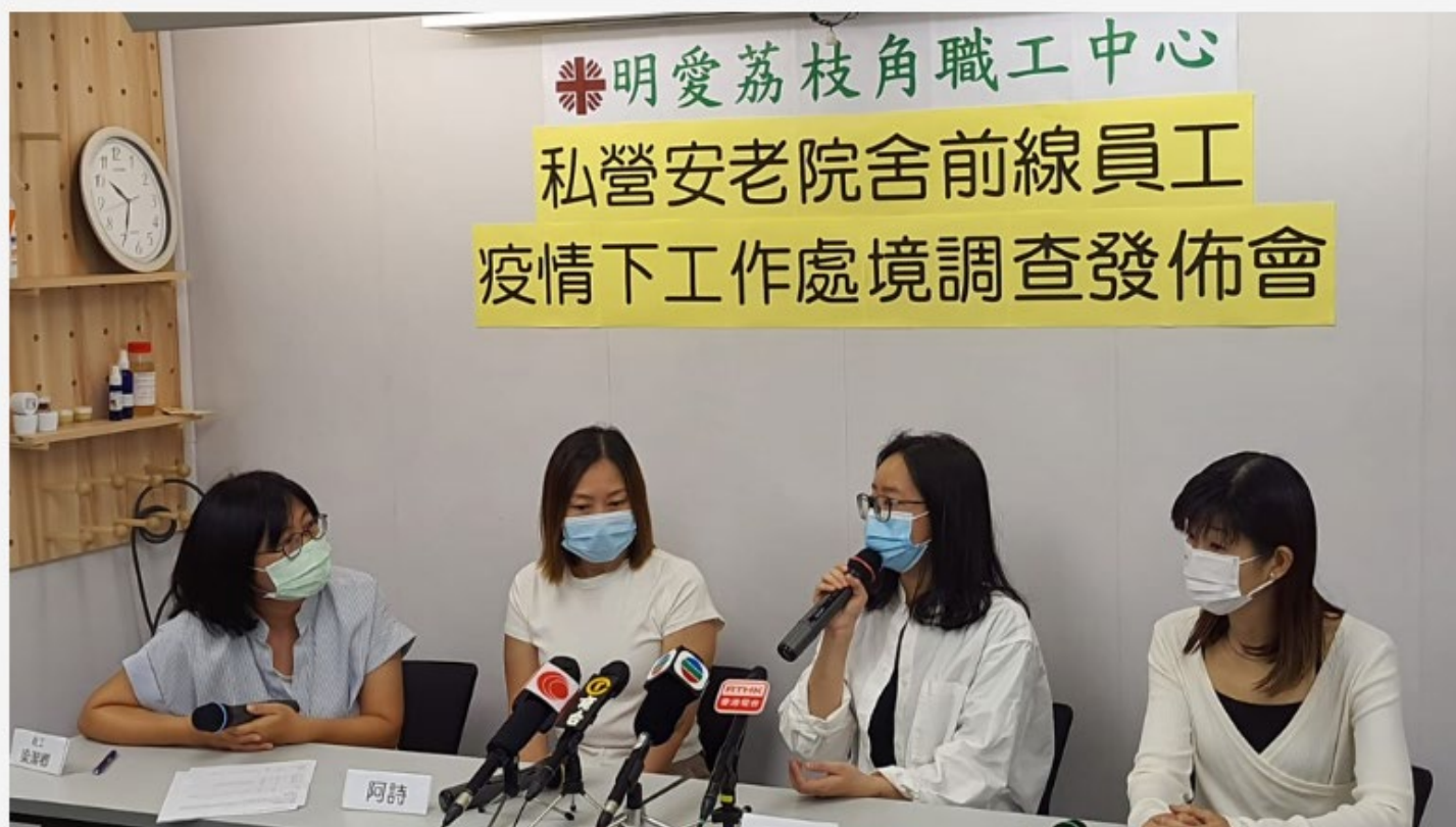
▲ 明愛荔枝角職工中心發布私營安老院前線員工疫情下工作處境調查結果。

明愛荔枝角職工中心今日（14日）發布私營安老院前線員工疫情下工作處境調查結果，結果顯示，私院護理員及保健員普遍工時為11小時或以上，連續工作日數的中位數為14日，近九成半人表示身體因工作勞損，有痛楚或麻痺的情況。該中心建議政府制訂院舍標準工時，每日工時以9小時為限，並改善薪酬福利待遇，或有助吸引新人入行。