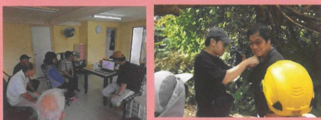
防災大使參與 防災短片拍攝工作