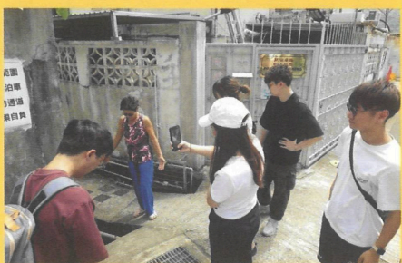
義務工程師到水浸高危地方，向街坊了解水浸風險