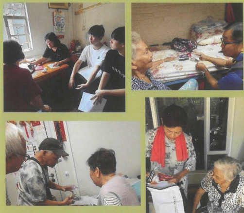
防災大使落區 進行家訪評估