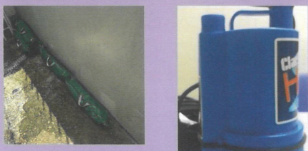
協助加強家居擋水 及去水能力