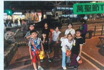
萬聖節Trick or Treat