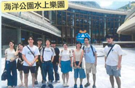
海洋公園水上樂園

我們在過去一年多番與街坊走訪不同地方和主題樂園，讓區內青年、長者和家庭都可以開心共渡假期！